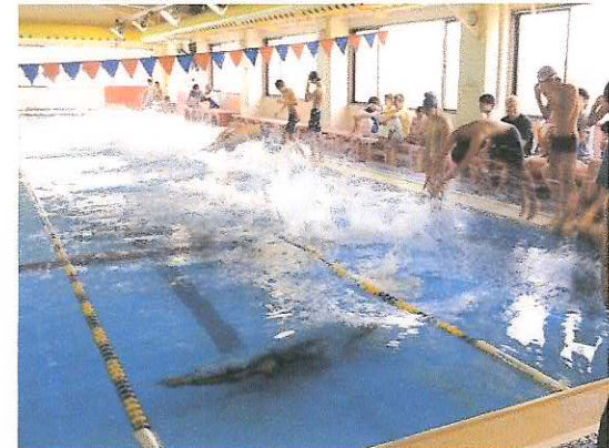
お楽しみ宝さがし。当たりを目指してザップ〜ン!