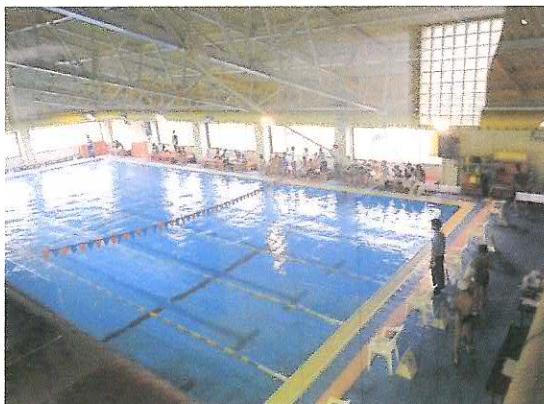
プールサイドにはたくさんの選手や応援の人達が!