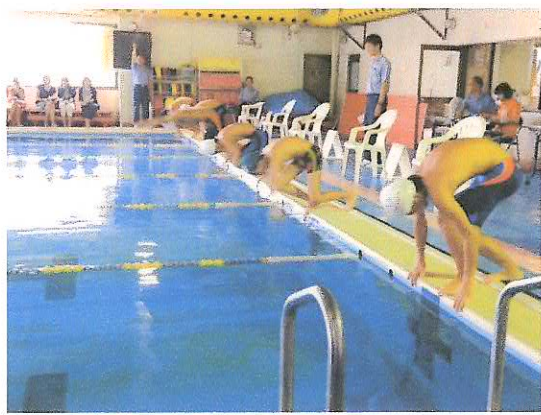
位置について...よう〜い...バ〜ン